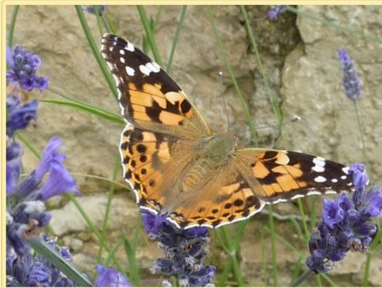
Vanessa cardui (=Cynthia cardui)